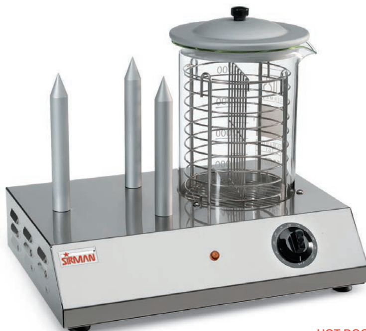
HOT DOG 3