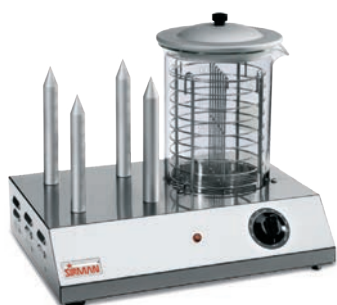
HOT DOG 4