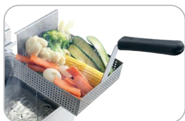
Cestello per cottura a vapore opzionale Optional steam cooking basket mm 200x220 h.60