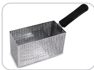
Cestello maxi: di serie per mod. 10 / opzionale per mod. 8 Maxi basket: standard for mod. 10 / optional for mod. 8