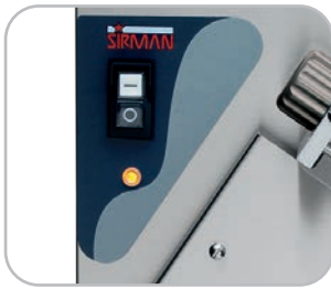
Comandi IP 54 per versioni standard Standard versions with IP 54 controls