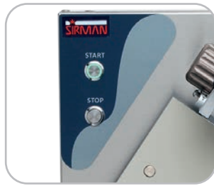
Comandi in acciaio inox IP 67 per versioni Plus Plus versions with IP 67 stainless steel controls