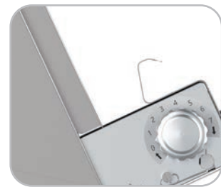
Protezione salvamano con bordo arrotondato Hand guards with rounded edges