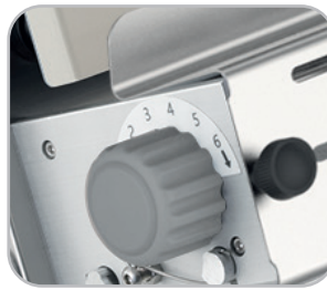
Manopole regolazione spessore rulli in plastica Adjustable thickness by plastic knobs