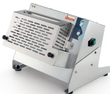
P-ROLL 320/1 PLUS