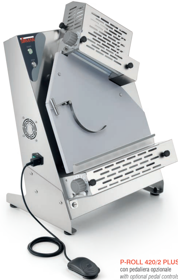
P-ROLL 420/2 PLUS con pedaliera opzionale with optional pedal controls