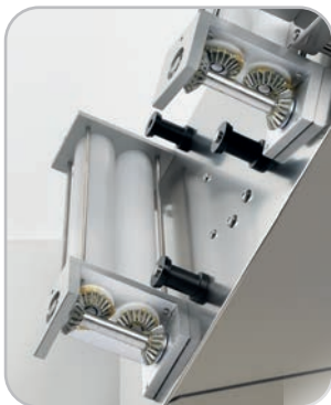
Sistema di trasmissione ad ingranaggi metallici Metal gears transmission