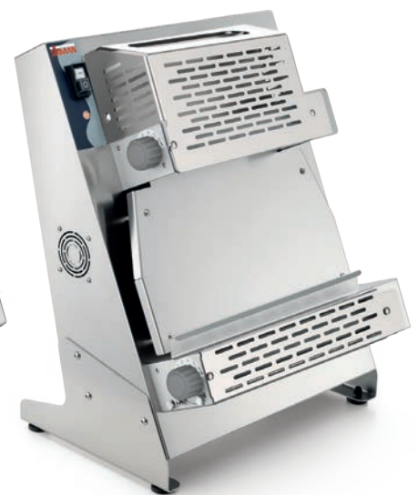
P-ROLL 420 RP