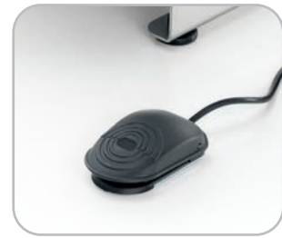
Pedaliera opzionale per versioni Plus Optional pedal controls for Plus versions