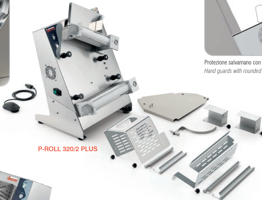
P-ROLL 320/2 PLUS