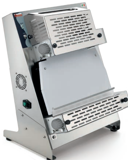
P-ROLL 420 RP PLUS