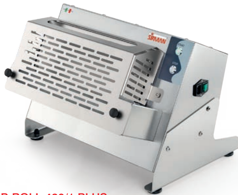
P-ROLL 420/1 PLUS