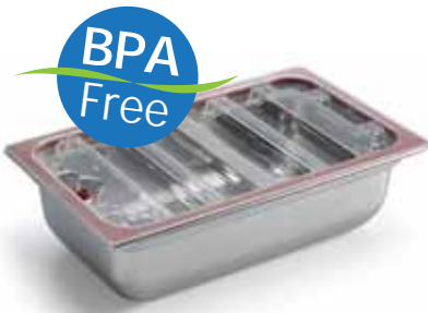
Contenitori GN 1/1 - 1/2 - 1/3 (h.100/150) con coperchio in Tritan opzionali Optional containers GN 1/1 - 1/2 - 1/3 (h.100/150) with cover in Tritan 0-80% vuoto / vacuum