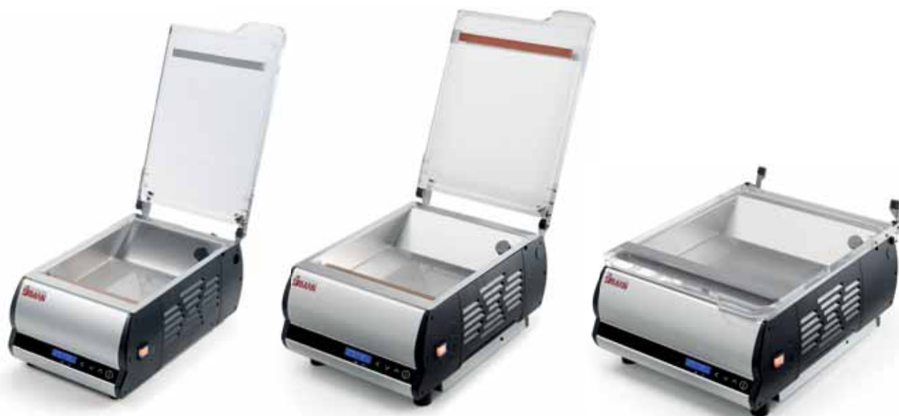
EASYVAC TOUCH 25 BX