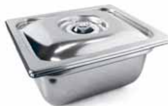
Contenitori GN 1/1 - 1/2 (h.100/150) con coperchio inox opzionali Optional containers GN 1/1 - 1/2 (h.100/150) with s/steel cover 0-100% vuoto / vacuum