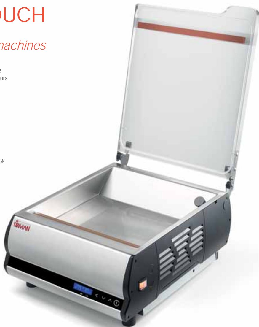
EASYVAC TOUCH 40 BX