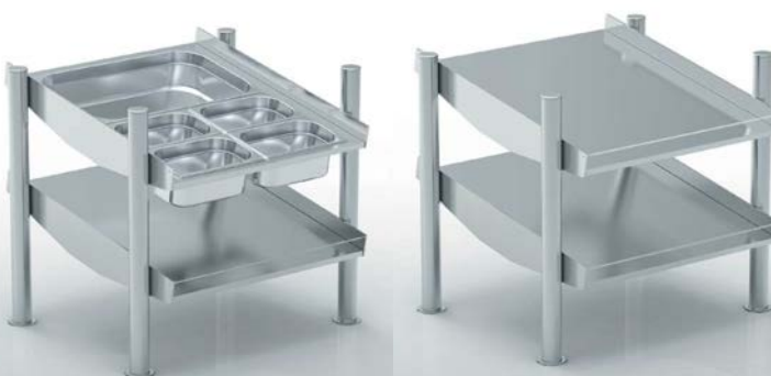
Modelo / Model SDPS