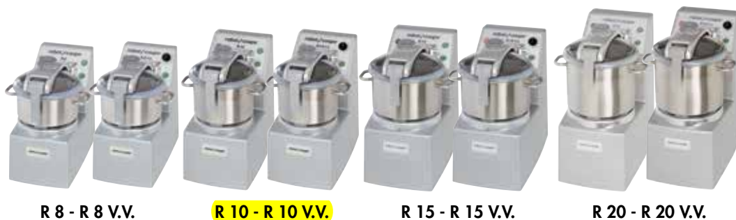
R 8 - R 8 V.V.