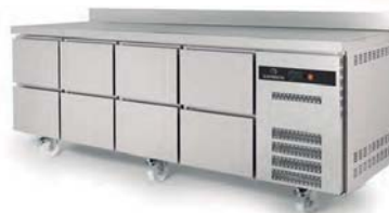
TGR-225-S ruedas y cajones opcionales with extra drawers ans castors